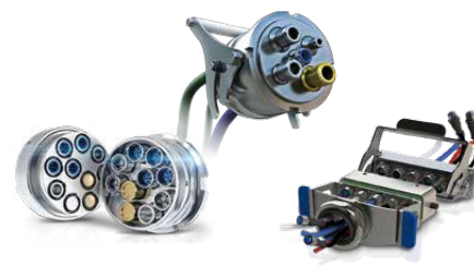
MULTILINE ADAPTIV / E